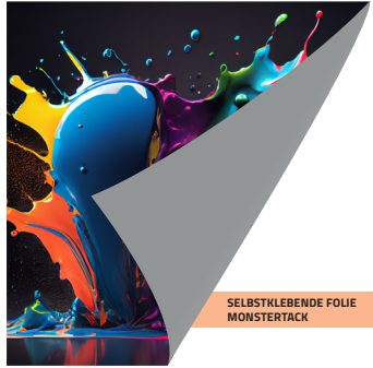
SELBSTKLEBENDE FOLIE MONSTERTACK