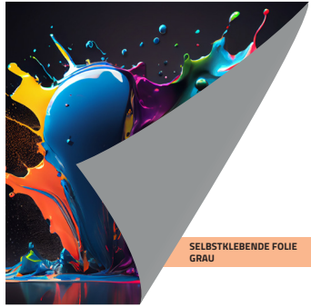
SELBSTKLEBENDE FOLIE GRAU