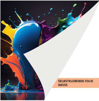
SELBSTKLEBENDE FOLIE WEISS