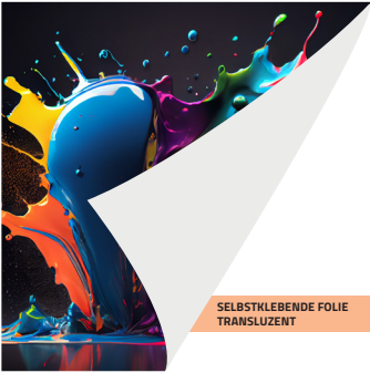
SELBSTKLEBENDE FOLIE TRANSLUZENT