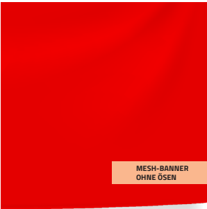
MESH-BANNER OHNE ÖSEN